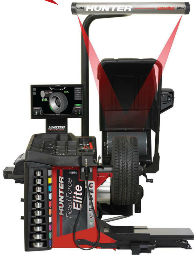
상기 사진에는 옵션 품목이 포함되어 있습니다.